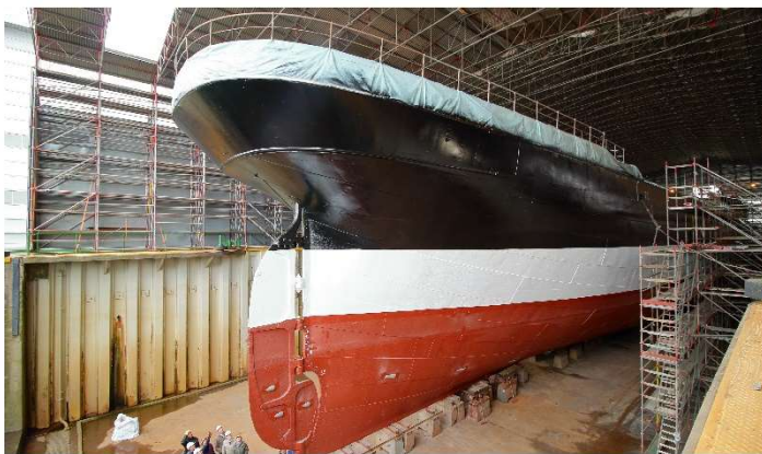
PEKING | Wewelsfleth | Restaurierung – zweites Jahr